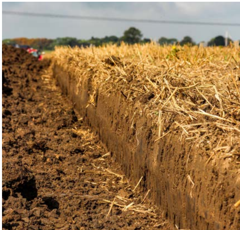
Sniglar är känsliga för all jordbearbetning, men plöjning är ett effektivare sätt att bekämpa dessa jämfört med kultivering.

Fuktig markyta är viktigt för vetemyggans larver. Om det blir tillräckligt fuktigt i marken på våren, lämnar larverna kokongerna och kryper upp mot markytan där de förpuppas. Reducerad bearbetning med halmrester i ytan hjälper till att hålla markytan fuktig och är därför gynnsamt för vetemygga.