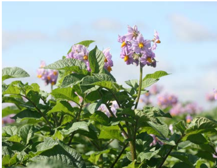
Det finns potatissorter med god motståndskraft mot både bladmögel och brunröta.

Det finns sorter med god motståndskraft mot både potatisbladmögel och brunnröta som bör odlas där dessa sjukdomar är problematiska. En sort med bra motståndskraft mot bladmögel men som är känslig för brunröta kan ge stora problem i form av angrepp av brunröta. När det gäller stärkelsesorter så är de generellt sett mera motståndskraftiga mot bladmögel än matpotatissorterna. I matpotatis är sorten Sarpo Mira den sort som just nu har både bra resistens mot bladmögel och brunröta. Sortskillnader finns för mottaglighet av Alternaria . Störst betydelse har sjukdomen i stärkelsepotatis. Stärkelsesorten Kuras är något känsligare än övriga sorter.