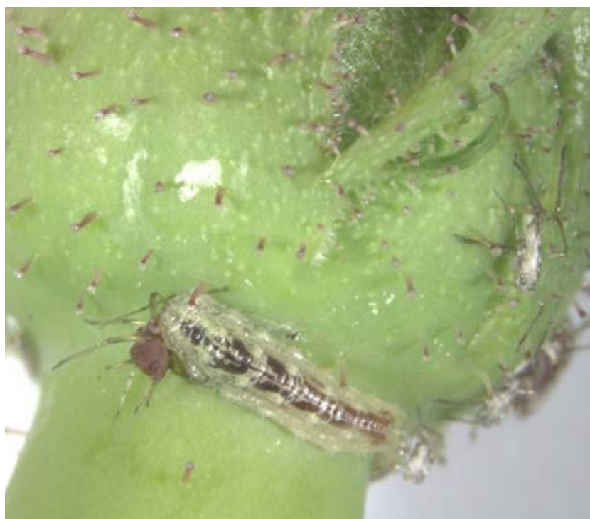
Blomflugelarven äter en bladlus.

Som bonus ger ört- och gräsbevuxna kantzoner även skydd åt fältvilt och fungerar som födoresurs för fälthöns och andra frätande fåglar.