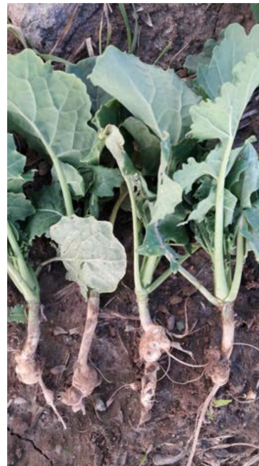
Klumrotsjuka i höstraps. Svampsjukdomen angriper korsblommiga arter som till exempel raps, vitsenap, vitkål och flera ogräs.