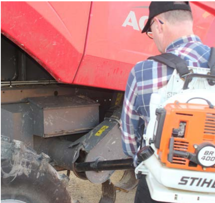
En vanlig lövblås är enligt många ett mycket effektivt redskap för utvändigt rengöring av boss och agnar.