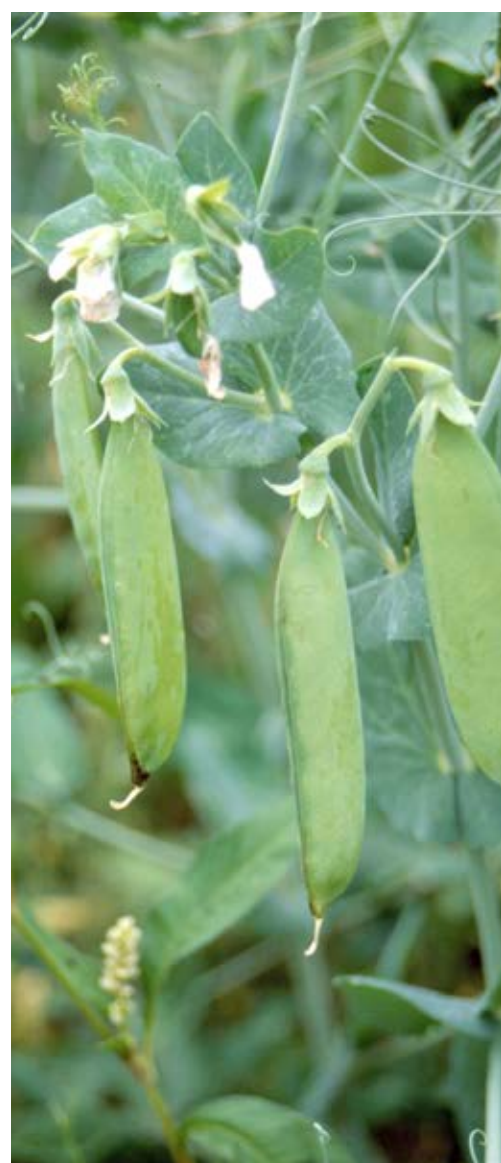
Det finns inga skillnader i känslighet för Phytophthora-rottröta hos ärter.

Sortskillnader i motståndskraft mot ärtrottröta och ärtbladmögel i ärter finns beskrivna för konservärtsodling, men inga uppgifter finns för övriga ärtsorter.