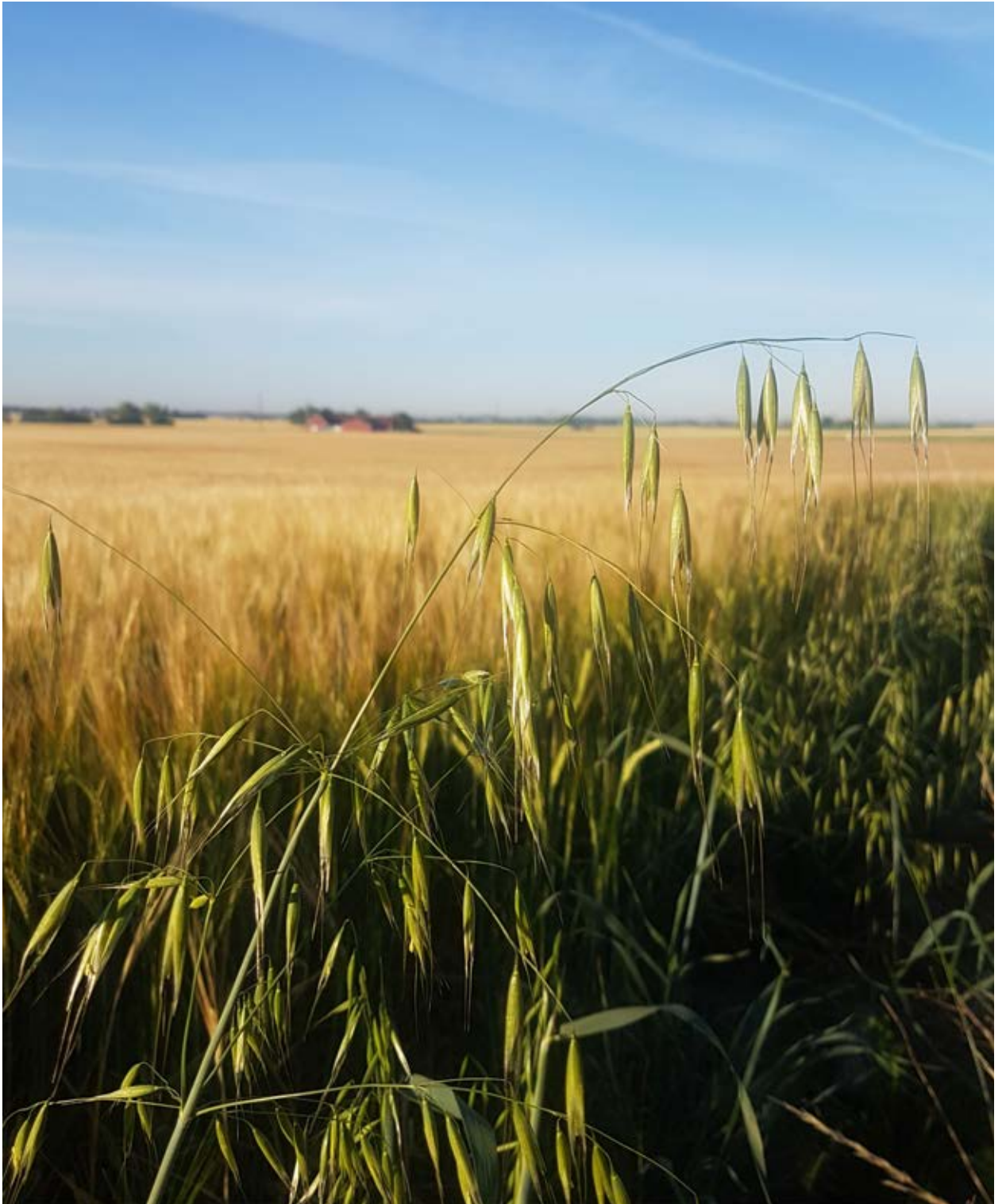
Falsk såbædd är effektiv mot tidigt groende ogräs som flyghavre.