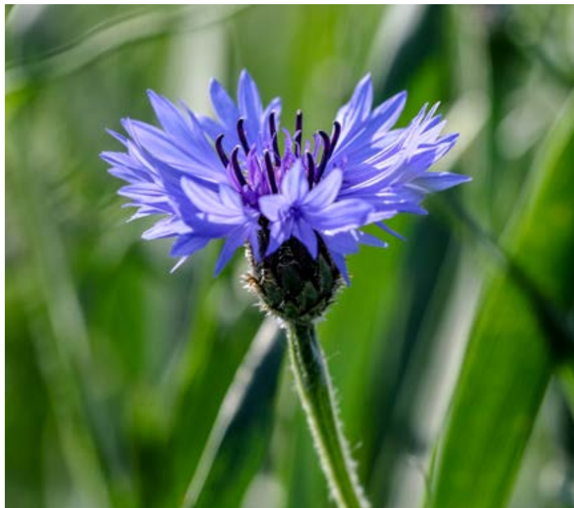
Blåklint är ett vinterannuellt ogräs och gror främst på hösten.

I en växtföljd med en stor andel höstsådda grödor gynnas vinterannuella ogräs, se exempel på ogräsen i tabell 7. Ogräsen gror främst på hösten. Vid höstgroning övervintrar ogräsen i vegetativt stadiet och blommar och sätter frö följande sommar.