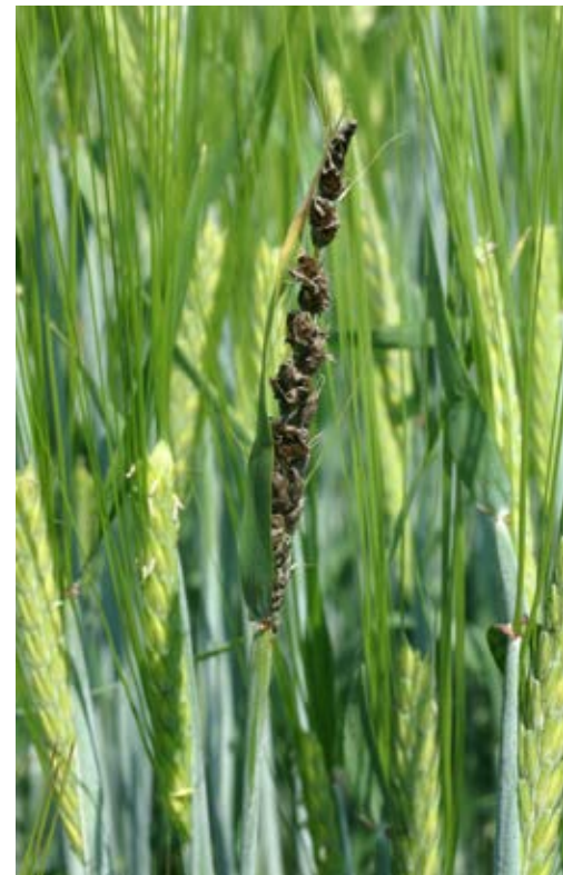
Flygsot kan snabbt uppföräkas om man använder samma utsädesparti i flera år.

Flera såtidsförsök under senare år visar på förvånansvärt små skillnader i skörd genom att förskjuta såtidpunkten någon eller några veckor från det "normala". En sammanställning av 10 försök i Skåne 2011 – 2013 visar att sådd den 15 september gav 9,1 ton/ha, 1 oktober 9,3 ton/ha och 15 oktober 9,1 ton/ha. En försöksserie under åren 2015 – 2017 visar att oavsett om man befinner sig i Östergötland eller Skåne så är sådd av höstvetete fram till månads-skiftet september/oktober relativt riskfritt ur ett skördeperspektiv. Sådd ännu senare, i mitten av oktober, har ett av åren gett signifikant lägre skörd i Östergötland. Även andra aktuella försök med sådd i mitten av oktober har försökmässigt gett cirka tio procent lägre skörd jämfört med sådd i mitten av september.