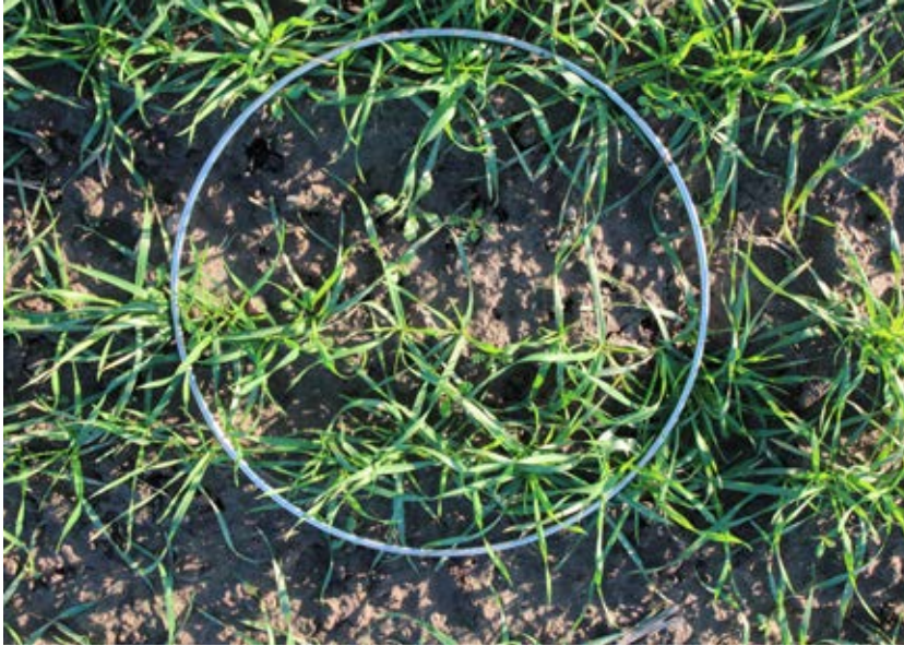
Höstvete sått den 28 september i Skåne. Ogräsförekomsten är 100 stora och 50 små ogräs per kvadratmeter. Bilden tagen i november.

För att långsiktigt kunna hantera svårbekämpade och resistensutsatta arter som renkavle är såtidpunkten en viktig del i den samlade ogrässtrategin. Men det är inte bara gräsogräs som påverkas. Fotona nedan visar på skillnader i örtogräsförekomst i ett höstvetefält i Skåne hösten 2018 med två olika såtidpunkter. Platserna gränsade intill varandra på samma fält med samma förfrukt, potatis. En såtidpunkt i exempelvis mitten av september hade gjort skillnaden än tydligare när det gäller ogräsförekomst.