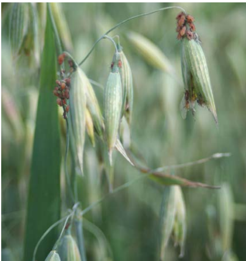
Sortblandningar kan minska angreppen av löss visar forskning.

I sortförsöken graderas eventuella skillnader i sorternas stråstyrka. Genom att välja stråstyva sorter och sorter med mindre axbrytning minskas behovet av tillväxtreglering. Även vinterhärdigheten i höstgrödorna graderas i sortförsöken. I områden där utvintring är ett problem välj sorter som oftast visat god övervintring i sortförsöken. Anpassa också utsädesmängden efter såtidpunkten för att undvika för täta bestånd under höst och vinter eftersom det ökar risken för utvintringssvampar.