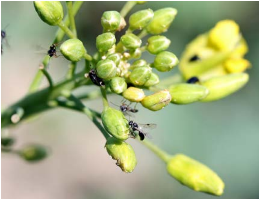
Parasitsteklar söker efter rapsbaggelarver. Antalet parasitsteklarna ökar vid reducerad jordbearbetning.