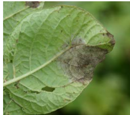
Odlar inte potatis oftare än vart femte år för att minska risken för bland andra potatisbladmögel.

Sockerbetor är en bra omväxlingsgröda till stråsäd men även i sockerbetor finns det jordburna sjukdomar och skadegörare som kan orsaka stora skördeförluster. Därför är det viktigt att hålla smittotrycket nere genom att inte odla sockerbetor oftare än vart fjärde år. Av de jordburna sjukdomarna är det bland annat rotbrand som kan orsaka betydande plantbortfall i sockerbetor. I rotbrandskomplexet ingår flera svampar vilka är vanliga i de flesta jordar som till exempel Aphanomyces , Pythium , Phoma , Rhizoctonia och Fusarium .