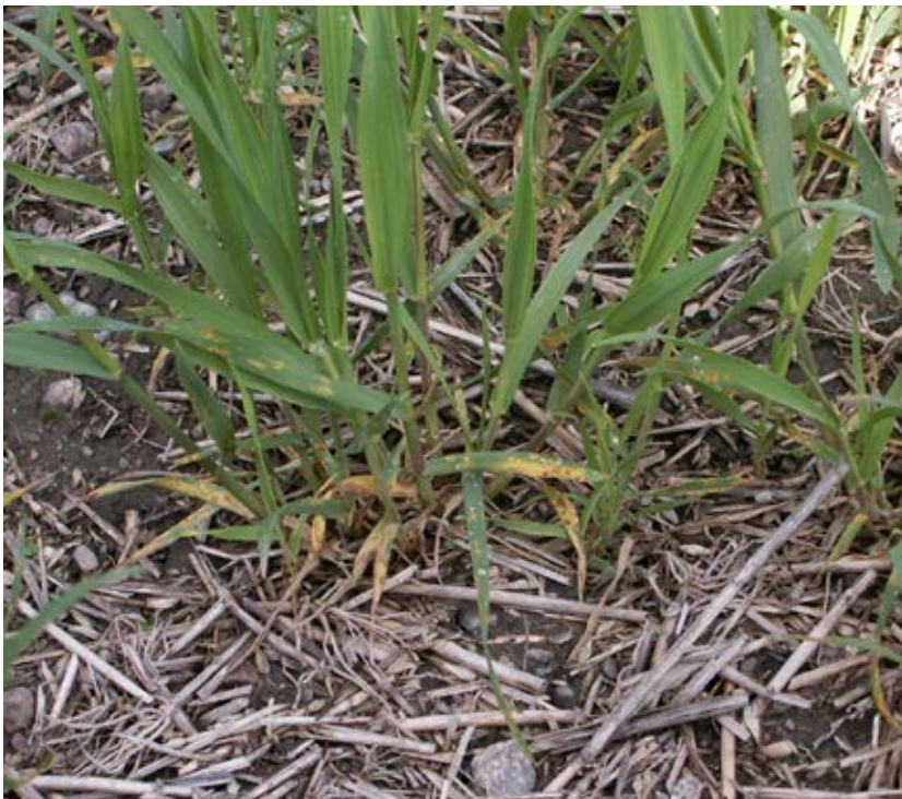
Risken för smittspridning ökar om höstveten odlas efter höstveten speciellt vid reducerad jordbearbetning. Bilden visar höstvetplantor som infekterats av vetets bladfläcksjuka.

Det finns ytterligare exempel på svampsjukdomar i andra grödor som sprids med smittade växtrester, till exempel bladfläcksvampar i majs och chokladfläcksjuka i åkerbönor. Gemensamt för alla svampsjukdomarna är att nedbrukning av smittade skörderester är en viktig förebyggande åtgärd mot smittspridning.