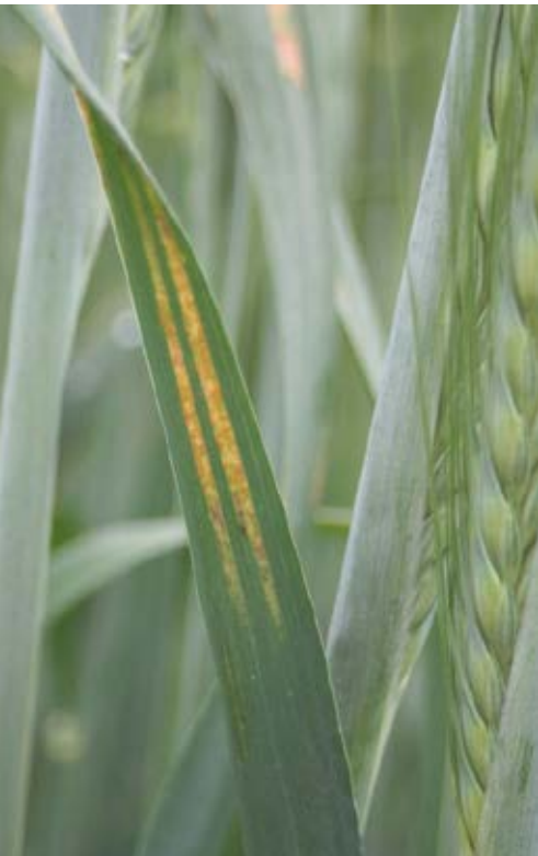
Tänk på att följa grödan under säsong. Nya raser av gulrost kan uppstå.