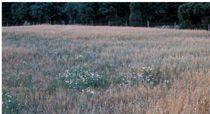
Angrepp av havrecystnematod som ofta uppträder i fläckar. När havren skadas och sätts tillbaka får ogräset möjlighet att ta plats.

Stråsädescystnematoderna kan angripa alla stråsädesslag samt majs, vallgräs och ogräs ur gräsfamiljen. De olika arterna angriper delvis olika värd-