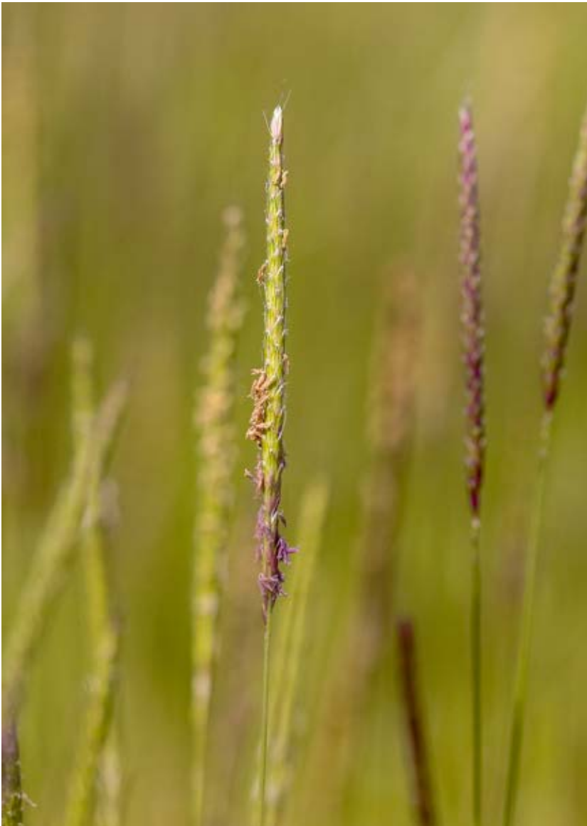
Renkavle är ett vinterannuellt gräsogräs som gynnas av höstsädesdominerade växtföljder.

Gräsogräsen är generellt ett stort problem i höstsädesdominerade växtföljder, inte minst när man använder sig av konceptet plöjningsfri odling, vilket ofta gynnar gräs- och rotogräs. Direktsådd utan jordbearbetning minskar däremot groningen och förekomsten av renkavle i infekterade fält och förmodligen också av andra höstgroende ogräs. I nuläget har man växtföljder med mycket stor andel höstsådda grödor i slättbygderna i Götaland och Svealand. Detta har medfört att renkavle blivit ett allt vanligare ogräs. I Skåne har man haft problem med detta under många år men numera förekommer renkavle även i Öster- och Västergötland. Enstaka fynd av ogräset har även gjorts i Mälardalen. Renkavle är inte det enda gräsogräs som ställer till problem i höstsådda grödor, även åkerven är ett stort problem, speciellt på lättare jordar. Dessutom kan vitgröe , rajgräs och lostor ställa till problem för odlarna.