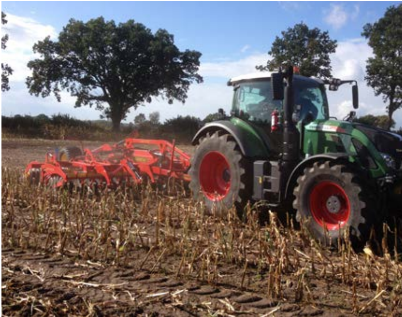
Stubbearbetning efter majsskörd.

tillskott till fröförrådet i marken. Överlevnaden förbättras kraftigt av att fröna hamnar ett par centimeter ner i jorden. Undantagen är främst luddlosta och om halmen är borttagen även sandlosta , där man bör göra en grund bearbetning direkt efter skörd.