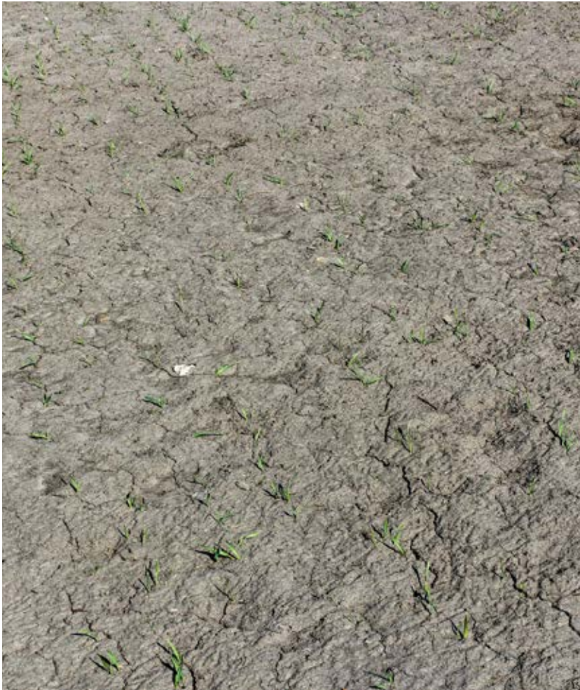
Problem med slamning och skorpa kan minskas med reducerad bearbetning som ger ökad andel växtrester i markytan.

Med plöjningsfri odling eller reducerad jordbearbetning menar man att plogen ersätts med en kultivator eller någon form av tallriksredskap, alltså en minskning av både djup och intensitet. Begreppet omfattar ofta alla metoder från direktsådd utan föregående jordbearbetning till grundare plöjning med en begränsad efterbearbetning före sådd.