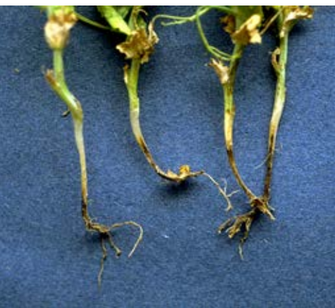
Ärtrottröta ger mörka stjälbaser och dåligt utvecklade rotsystemet. Plantan vissnar.

Baljväxter är utmärkta omväxlingsgrödor i stråsådesdominerade växtföljder men de angrips ofta av jordburna patogener om de återkommer för ofta på samma fält. Många av baljväxterna har gemensamma sjukdomar vilket skall beaktas vid planeringen av en växtföljd. En tumregel är att inte odla baljväxter oftare än vart 7–8 år i en växtföljd men undantag finns. I tabell 6 redovisas de viktigaste sjukdomarna för några av de arter som odlas i Sverige. De viktigaste jordburna patogenerna är ärtrottröta ( Aphanomyces ) och rotröta ( Phytophthora -rotröta) i ärter och åkerbönor. Många baljväxter angrips också av svampar inom det så kallade rotrötekomplexet. Detta består av Fusarium solani , Rhizoctonia solani och Thielaviopsis basicola . Vid inventering på 1980-talet av rot- och hypokotylrötter i bruna bönor på Öland hittades angrepp av samtliga svamparter som ingår i komplexet. Det visade sig att man behövde minst 6 år mellan böngrödorna för att undvika allvarliga skador. Oftast räknas också Pythium -arter till komplexet.