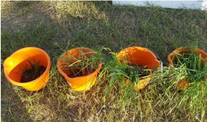
Spannar med renkavleplantor plockade från jämförbar yta i fyra olika grödor sådda i ett infekterat fält i England. Från vänster, plantor som vuxit i vårkorn, vårvete, höstkorn och höstvete. Bäst konkurrerade vårkornet.