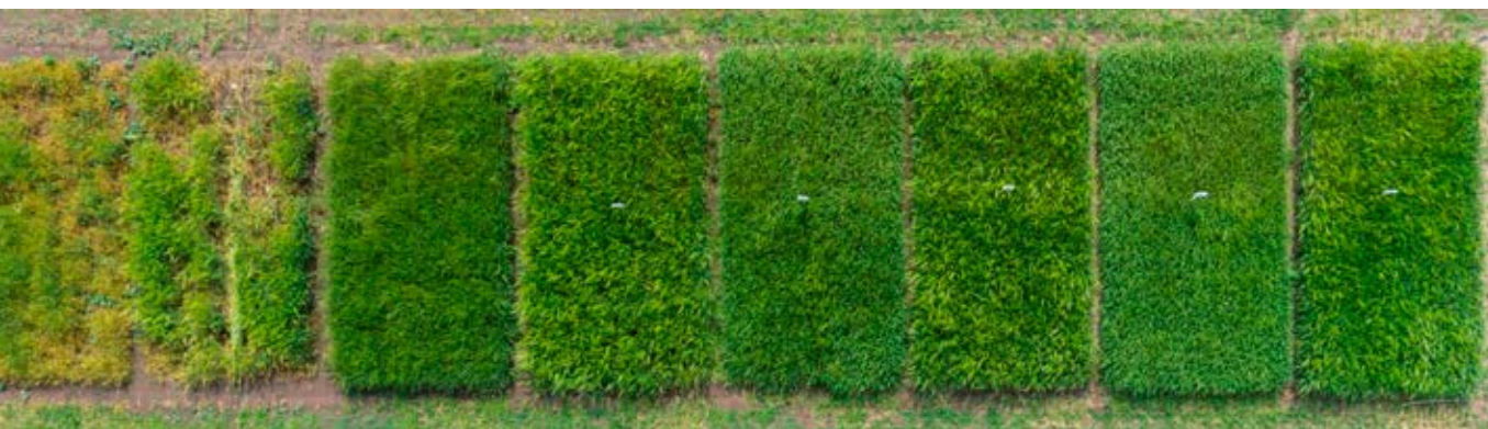
Foto taget i maj 2015 på en demonstrationsodling av höstkorn på Öland. Två sorter Matros (linjesort) och Wootan (hybrid-sort) såddes vid fyra såtidpunkter (5/9, 15/9, 25/9, 6/10). De två parcellerna till vänster är de tidigaste sådda och mest angripna av rödsot. Bilden visar också att det inte var någon skillnad mellan sorterna.

Sydsverige även om det förekommer i Mellansverige. Under milda höstar i kombination med tidig uppkomst och mycket bladlös i höstsäden, kan viruset medföra mycket stora skador som till exempel i Skåne, Blekinge och Kalmarområdet med Öland 2015. De kraftigaste angreppen förekommer främst vid tidig sådd, före 10–15 september i Sydsverige och 5–10 september i norra Götaland. Ju tidigare sådd och uppkomst, desto större angrepp. För varje veckas fördröjning av sådden kan upp till en halvering av angreppen av rödsotvirus uppnås.