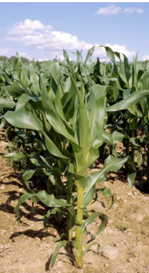
En viktig förebyggande åtgärd mot angrepp av bladfläcksvampar i majs är att inte odla majs efter majs och att plöja efter majsgrödan.