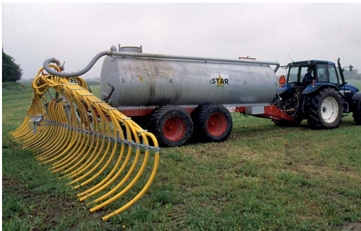
Många ogräsfrön överlever i flytgödsel eftersom ingen kompostering sker.