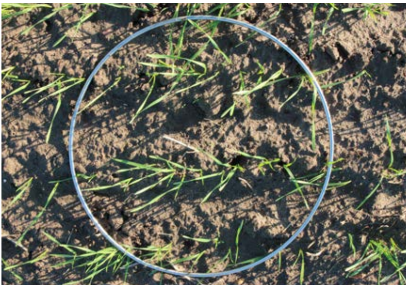
Samma fält som på bilden ovan men här är såtidpunkten 15 oktober. Ogräsförekomsten är 100 små ogräs per kvadratmeter. Bilden tagen i november.