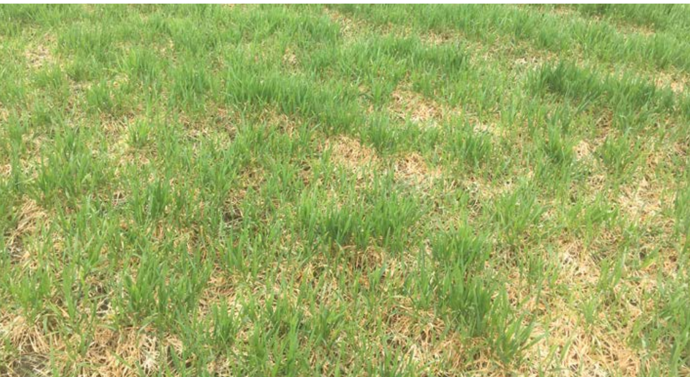
Angrepp av snömögel våren 2018 i ett höstvetete sått i augusti i Mellansverige.

Frodiga bestånd ökar risken för utvintringsskador orsakade av snömögel och trådklubba . Den sistnämnda gäller främst för höstkorn. Ett frodigt bestånd under en mild vinter kan fungera som ett "täcke" och ge samma gynnsamma mikroklimat som ett snötäcke på otjälad mark. Snömögelsvampen kan växa från planta till planta i ett frodigt bestånd och det kan ge omfattande angrepp om marken är otjälad. För att inte få för frodiga bestånd bör man undvika tidig sådd och/eller anpassa utsädesmängden efter såtidpunkten.