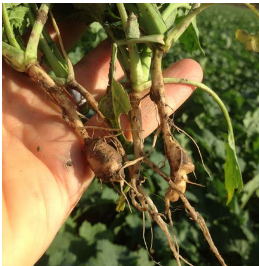
Klumprotsjuka kan spridas med smittad jord från fält till fält med maskiner och redskap.

Vid leverans av demonstrationsexemplar eller begagnade redskap bör dessa noggrant besiktigas på jord och växtrester. I synnerhet om de kommer från marker som man inte har kännedom om. Förutom renkavle och hönshirs så kan flera jordburna sjukdomar spridas via maskiner och redskap. Framst bör man se upp med klumprotsjuka . Så lite som 1 dl jord kan räcka för att sprida sjukdomen till osmittad mark. Detta gäller även potatiskräfta och olika typer av cystnematoder . De senaste åren har flera svenska potatisodlare drabbats av nematoder och potatiskräfta. Förutom smittat potatisutsäde kan maskiner vara orsaken till att smittan spridits.