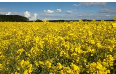
Det finns sorter av oljeväxter som är toleranta mot klumprotsjuka.