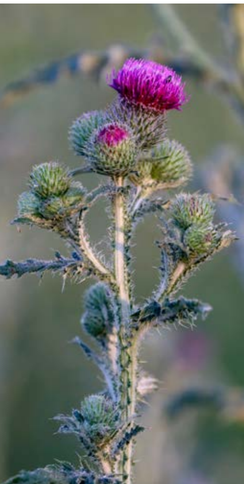
Krustisteln är en tistelart som är tvåårig till skillnad mot åkertisteln som är flerårig. Krustisteln förekommer oftast i vallar och radodlade grödor.