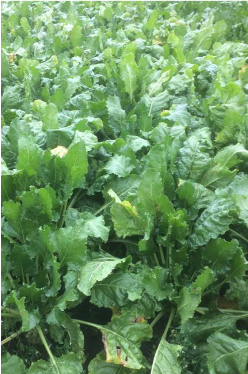
Det finns sockerbetsorter som är toleranta mot angrepp av betcystnematoden.

Det finns idag inga sockerbetsorter som är helt resistenta mot betcystnematoden, däremot finns det sorter som är toleranta mot angrepp. Nematodens uppföring är mindre i toleranta sorter än i mottagliga sorter. Vid höga nematodtätheter kan även de toleranta sorterna skadas. Odling av toleranta sorter har blivit den viktigaste åtgärden mot betcystnematoden. Nackdelen med att sorterna "bara" är toleranta är att de kan lämna efter sig höga nematodtätheter jämfört med om sorterna varit resistenta.