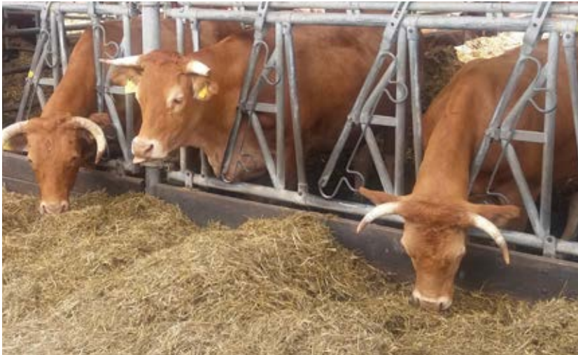
Nötkreatur har bättre förmåga att bryta ner ogräsfrön än enkelmagade djur som grisar.

När fodret äts och passerar genom djurmagen påverkas också ogräsfröna. Endast cirka en tredjedel av ogräsfröna överlever passagen genom djurmagen. Det finns dock skillnader mellan både ogräsarter och djurslag. Ju längre ogräsfröna befinner sig i djurens matsmältningsorgan desto sämre ser gröningsförmågan ut att bli. Överlevnaden kan variera mellan några enstaka procent till drygt femtio procent. Enkelmagade djur som grisar har generellt sämre förmåga att bryta ner ogräsfrön under matsmältningen än nötkreatur. Fjäderfä med muskelmage har bäst förutsättningar att bryta ner ogräsfrön under matsmältningen. Frön från gräsogräs har generellt lägre överlevnadsgrad än frön från tvåhjärtbladiga arter som till exempel svinmålla och åkerbinda . Frön från tvåhjärtbladiga arter har oftast tjockare fröskal än gräsfrön, vilket kan vara förklaringen.