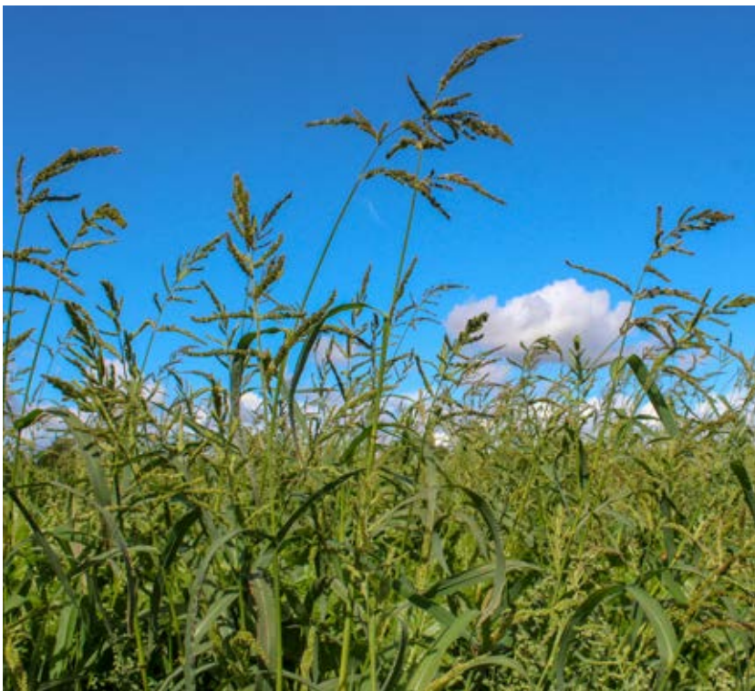
Hönshirs som är ett sommarannuellt gräsogräs gynnas av vårsädesdominerade växtföljder med radodlade grödor.

Hönshirs är ett relativt nytt gräsogräs i Sverige. Den är vår- och sommargroende och kräver värme. Nya plantor gro under hela sommaren. Hönshirs ställer till problem främst i glesa grödor som majs och potatis, i en tät stråsädesgröda har den svårare att konkurrera. För att hålla nere fröbanken vid infektion av hönshirs är det mycket viktigt med en bra växtföljd där både höst- och vårgrödor ingår.