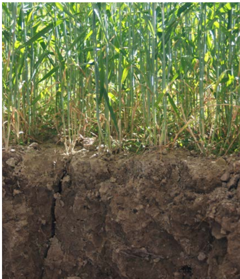
Jordens mullhalt är en viktig parameter för en god markstruktur och stabila skördar.

När jordens mullhalt ökar bidrar detta till stabilare och högre skördenivåer på jordar med låga mullhalter. Flera långliggande försök visar att jordar med mullhalt under 3,4 procent (2 procent kol) ger ökade skördar med mellan 3 och 9 procent då det sker en höjning av mullhalten med 0,17 procent (0,1 procent kol). Räkneexemplet nedan visar hur ekonomin i växtodlingen på en gård med låga mullhalter förbättras vid ökad mullhalt.