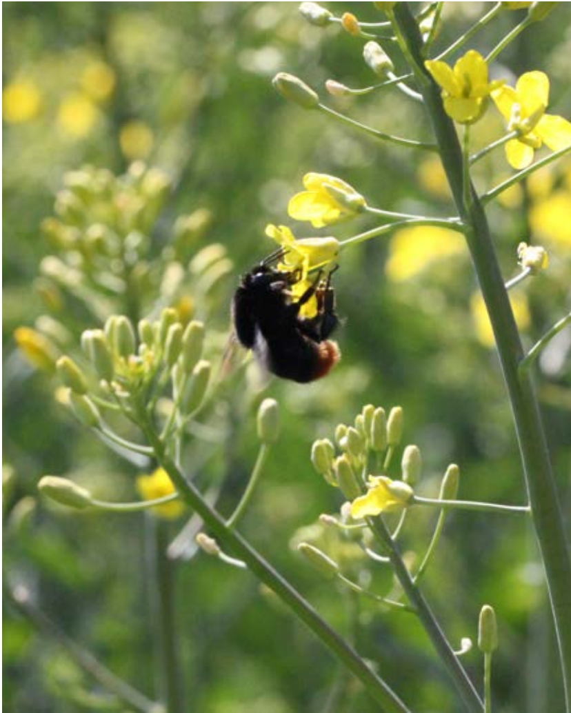
Humlor bidrar till en bra pollinering i höstraps.