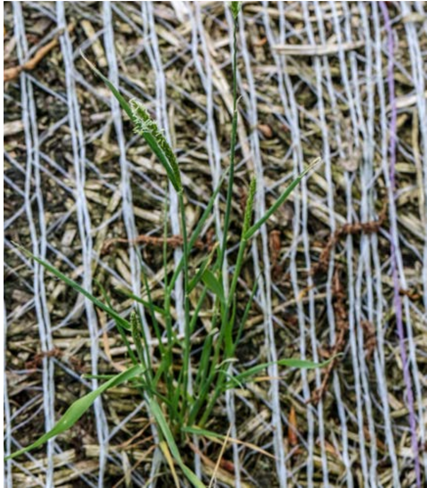
Renkavle som grott från en nätad storbal.

allvarliga arter som kan spridas med halm är flyghavre, renkavle, åkerven, lösta och i vissa fall även hönshirs . I torr halm är möjligheterna stora att fröna är livsdugliga efter transport och användning. Ställ som köpare frågan var ifrån halmen kommer och hur ogräsförekomsten i fältet är. Säljaren har ett stort ansvar att se till att svärbekämpade ogräs inte sprids. Handla inte med halm från fält med svärbekämpade ogräs.