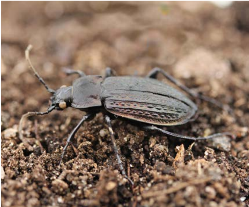
En jordlöpare rör sig uppemot 100 meter från fältkanten ut i åkern under en säsong i sin jakt på till exempel bladlöss.

I fält större än femton hektar är det lämpligt att anlägga en skalbaggsås. Orsaken är att avståndet mellan fältkanterna blir kortare i mindre fält. Plöj två plogdrag mot varandra så att du får en upphöjd jordbank, minst tjugo centimeter hög och cirka två meter bred. Skalbaggsåsen bör sträcka sig i fältets längdriktning och inte gå ända fram till fältkanten i någon ände. Detta förenklar brukandet avsevärt och minskar predationen från räv och grävling på fältvilt. Skalbaggsåsens avlånga form och att den avdelar fältet gör det också lättare för pollinerare att hitta ut i fältet eftersom de orienterar sig efter linjeelement.