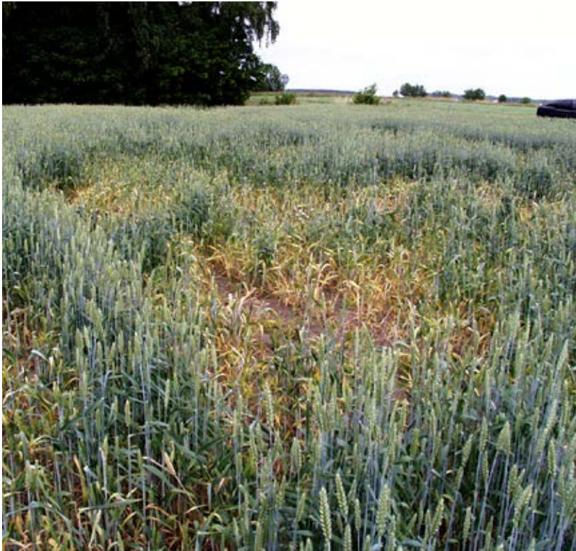
Tidig sådd ökar risken för vetedvärgsjuka.

Fritflugans tredje generation kan ge skador i nysådda fält av höstvetete, råg och rågvete. Flugan lägger sina ägg på huvudskottet som sedan angrips av den nykläckta larven. Huvudskottet gulnar och dör. Det är framför allt fält som är sådda under augusti och de första dagarna i september som kan drabbas av allvarliga skador. Varmt väder med temperaturer över 15 grader ger ökad risk.